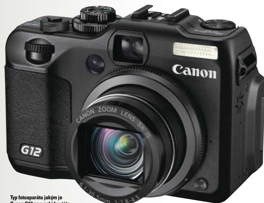
Typ fotoaparátu jakým je Canon G12 se v nabídce této značky vyskytuje delší dobu a je o něj stále zájem.

O tu se naopak v premiéře uchází Nikon svým modelem P7000. Jde o první fotoaparát tohoto typu, nicméně povedl se hned na první pokus. Ostatně jiný výsledek jsme od Nikonu ani nečekali. P7000 je o pár