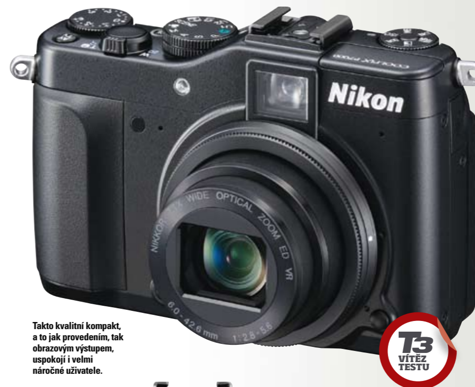
Takto kvalitní kompaktní fotoaparát, a to jak provedením, tak obrazovým výstupem, uspokojí i velmi náročné uživatele.