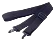
Popruh pro kufřík