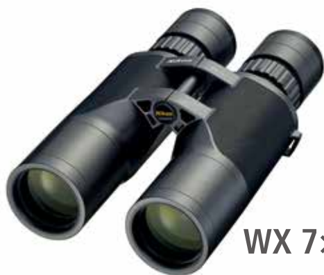
WX 7×50 IF