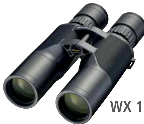
WX 10×50 IF